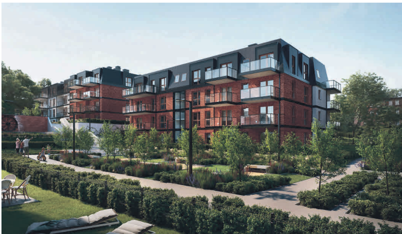
Młyny Gdańskie powstają przy ul. Malczewskiego, zostały zaprojektowane z myślą o koneserach codzienności, osobach ceniących jakość w każdym aspekcie życia.