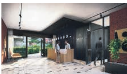
Reprezentacje lobby utrzymane będzie w duchu ponadczasowej elegancji.

Nieruchomości premium zyskują coraz większą popularność w Polsce. Nieopłacalne lokaty bankowe motywują do poszukiwań stabilnych inwestycji, takich jak luksusowe apartamenty. Czym wyróżnia się luksus? Poza świetną lokalizacją, ważnym elementem jest wyjątkowy charakter. Deweloperzy wraz ze sztabem architektów tworzą dla najbardziej wymagających klientów projekty „z duszą”.