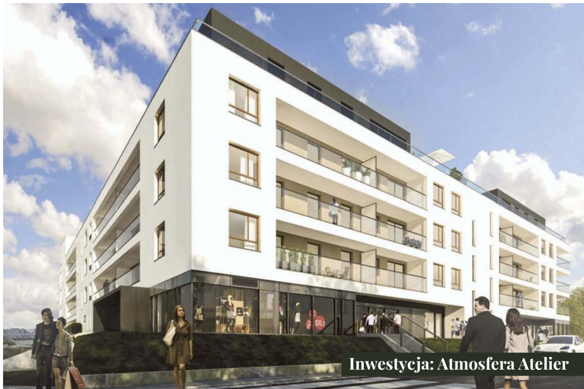
Inwestycja: Atmosfera Atelier