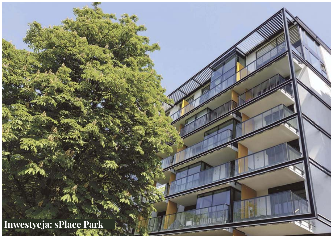
Inwestycja: sPlace Park

Misją firmy jest tworzenie wyjątkowych, eleganckich i komfortowych projektów przy zachowaniu najwyższych standardów jakości. Ta dynamiczna, prężnie rozwijająca się na polskim rynku firma, na swoje projekty wybiera najatrakcyjniejsze lokalizacje w dużych miastach. Deweloper należy do Polskiego Związku Firm Deweloperskich. Jedną z realizowanych przez hiszpańskiego dewelopera inwestycji jest sPlace Park. Osiedle powstaje na Żoliborzu, w jednej z najpiękniejszych i najbardziej prestiżowych dzielnic Warszawy. Zlokalizowane jest w zacisznej, zielonej części dzielnicy, w rejonie Sądów Żoliborskich. Inwestycja zaprojektowana została przez renomowaną pracownię architektoniczną „Mąka Sojka architekci”. Niewątpliwym wyróżnikiem jest starannie zagospodarowany, pełen zieleni teren osiedla. Trwa sprzedaż nowych etapów tej unikalnej inwestycji. Deweloper oferuje duży wybór mieszkań (od 1 do 5 pokoi) oraz apartamentów dwupoziomowych małych (już od 68 m 2 ) i dużych (już od 93 m 2 ). Praktyczne rozkłady mieszkań pozwalają na ich dowolną aranżację i optymalne wykorzystanie przestrzeni.