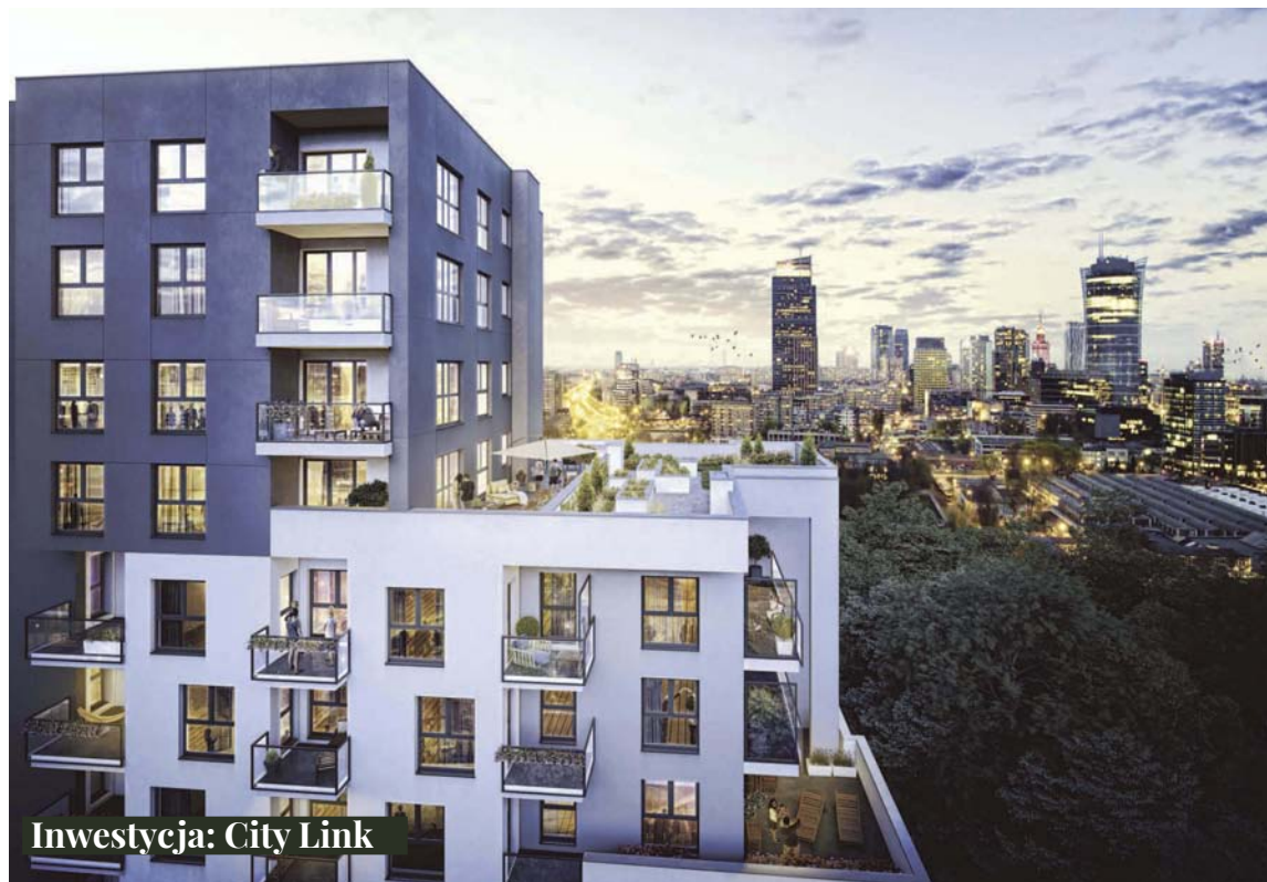
Inwestycja: City Link

Ronson Development działa na rynku nieruchomości od blisko 20 lat, budując mieszkania z myślą o indywidualnych potrzebach klientów. Ma na swoim koncie 25 zrealizowanych inwestycji, przede wszystkim w stolicy, ale również w Poznaniu, Szczecinie i we Wrocławiu. Od 11 lat spółka jest notowana na Giełdzie Papierów Wartościowych. Najlepiej sprzedający się projekt w ofercie Ronson Development to inwestycja City Link. Osiedle położone na warszawskiej Woli otwiera przed mieszkańcami tysiące możliwości jakie daje życie w centrum miasta. Cechuje je bogata infrastruktura usługowo-handlowa oraz dobrze rozwinięta sieć komunikacyjna. Osiedle położone jest tuż obok realizowanej właśnie stacji metra Płocka. Niewątpliwym atutem projektu jest również szeroka oferta mieszkań, już od 33 m 2 , wysoki standard wykończenia oraz plac miejski, który z pewnością będzie miejscem odpoczynku po pracy. City Link jest absolutnym bestsellerem, doskonałym do zamieszkania zarówno dla singli, jak i rodzin z dziećmi.