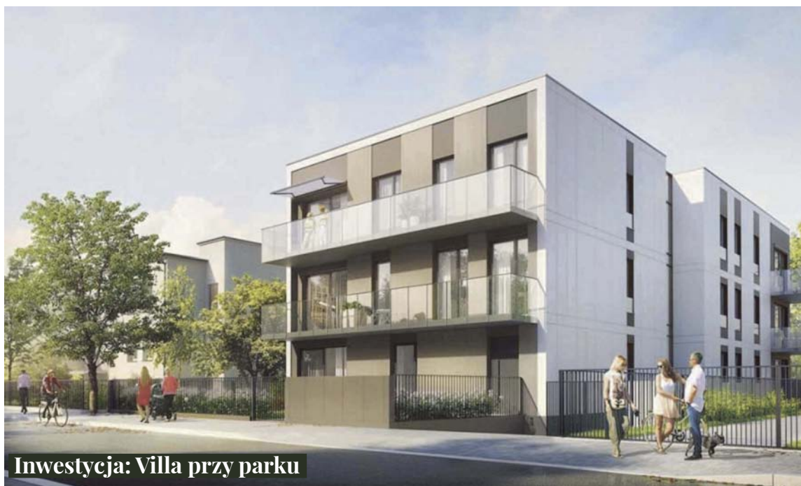
Inwestycja: Villa przy parku

Firma z wieloletnim doświadczeniem, działająca z sukcesem w branży budowlanej i nieruchomości. Zatrudnia inżynierów z branży budowlanej, tworząc zespół kompetentnych, uczciwych i odpowiedzialnie wykonujących swoje zadania profesjonalistów. Inwestycje budowlane realizuje w oparciu o system generalnego wykonawstwa. Wysokowyzkwalifikowana kadra inżynieryjno-techniczna pozwala firmie świadczyć usługi z zakresu zarządzania nieruchomościami – zarówno zrealizowanymi przez nią, jak i dla zewnętrznych wspólnot. COGIK świadczy także usługi w zakresie przygotowania i realizacji inwestycji budowlanych na zasadzie inwestora zastępczego. Apartamentowiec realizowany przy ulicy Łukiskiej w Warszawie to budynek stanowiący swoisty ewenement na mapie warszawskich inwestycji mieszkaniowych i wpisujący się filozofią firmy. W okolicy o niskiej zabudowie willowej powstanie budynek niezwykle – willa miejska, połączenie budynku wielorodzinnego z atutami budynku zarezerwowanymi wcześniej dla niskiej zabudowy otaczającej planowaną inwestycję.