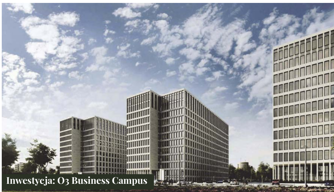
Inwestycja: O3 Business Campus