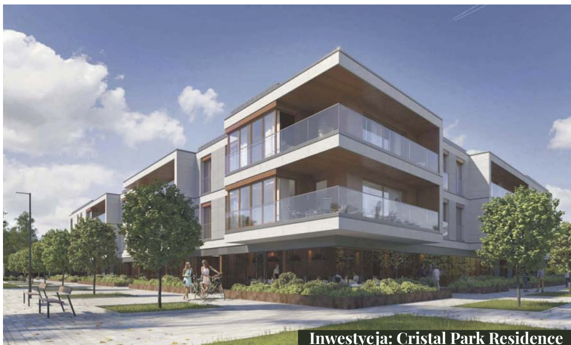
Inwestycja: Cristal Park Residence