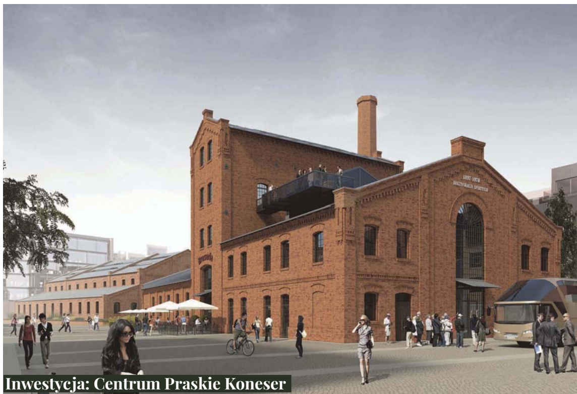
Inwestycja: Centrum Praskie Koneser

W dorobku i portfelu inwestycyjnym BBI Development znajduje się siedem projektów deweloperskich. Założenia wszystkich projektów są w pełni zgodne ze strategią inwestycyjną BBI Development, a ich wyróżnikiem jest niezwykle atrakcyjna, czasami wręcz unikalna lokalizacja nabywana za rozsądną cenę. W ciągu najbliższych lat podmioty celowe, w ramach których realizowane są przedsięwzięcia portfelowe spółki, poniosą wydatki inwestycyjne w łącznej kwocie ok. 1,5 mld zł i wybudują ok. 225 tys. m 2 powierzchni użytkowej. Oprócz wymienionych projektów spółka pracuje nad aktywizacją kolejnych atrakcyjnych przedsięwzięć. Powyższe czyni z BBI Development jednego z większych inwestorów na rynku przedsięwzięć deweloperskich, w szczególności na terenie Warszawy. W tę ideę wpisuje się Centrum Praskie Koneser. To niezwykle miejsce, znajdujące się w kwartale ulic Żąbkowskiej, Markowskiej, Białostockiej i Nieporęckiej na terenie Warszawskiej Wytwórni Wódek. Może ono służyć, jako przykład przestrzeni mixed-use, tzn. takiej, w której w jednym projekcie łączą się funkcje mieszkaniowe, handlowe, biznesowe i kulturalne. Położenie Centrum Praskiego Koneser w samym sercu warszawskiej Pragi zapewnia doskonałą komunikację i bliskość prestiżowych inwestycji miejskich.