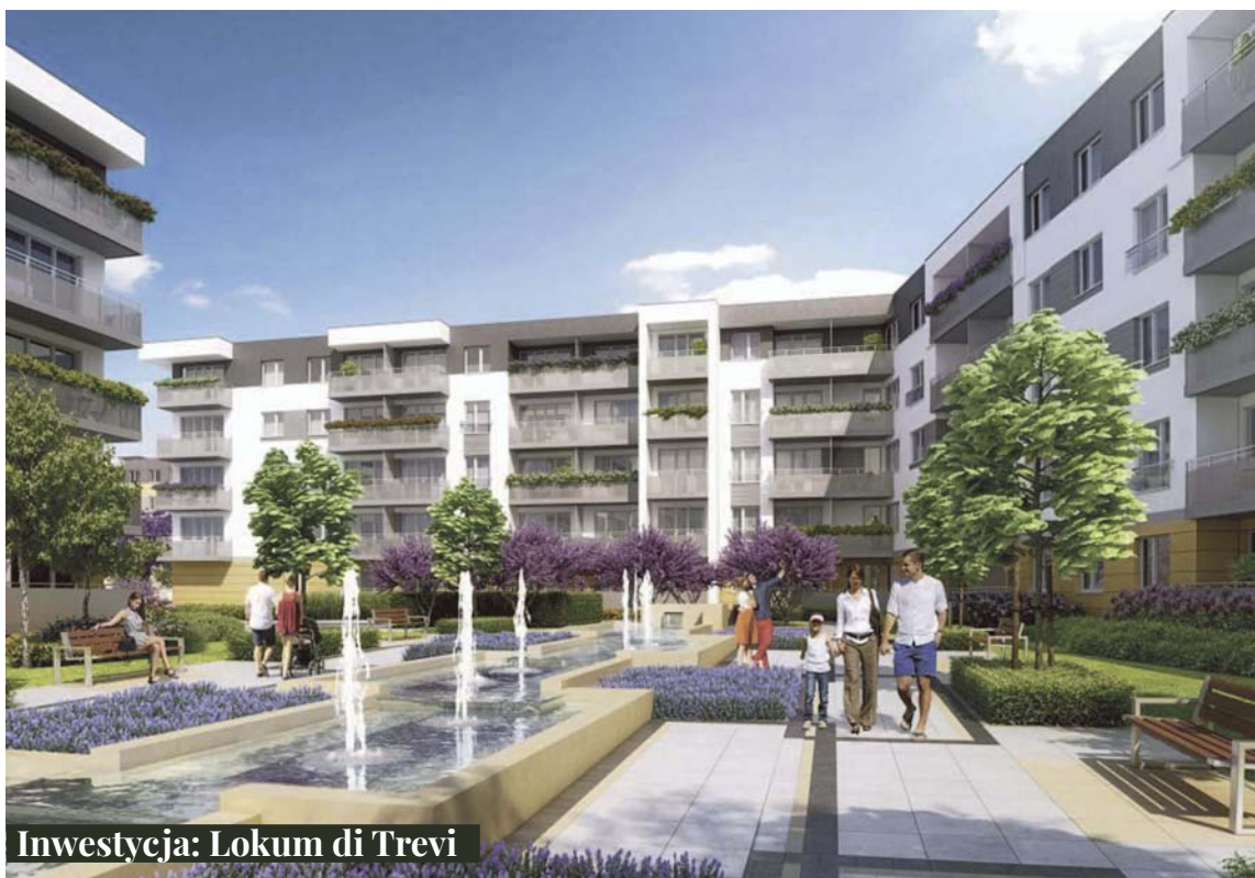
Inwestycja: Lokum di Trevi