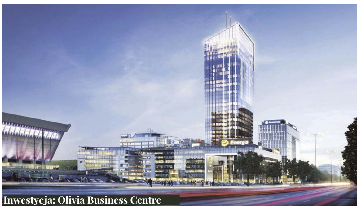
Inwestycja: Olivia Business Centre

Olivia Business Centre – największe centrum biznesowe w Polsce Północnej, zlokalizowane w samym sercu Trójmiasta stanowi szczególny adres dla ponad 500 topowych firm. Swoje siedziby mają tu m.in. Amazon, Arrow Electronics, Bayer, Energa, PwC, Ricoh, Sii, Fuji Film, Epam czy ThyssenKrupp. Ciesząca się renomą Olivia zapewnia rezydentom optymalne warunki funkcjonowania i rozwoju. Rozumiejąc, że o sukcesie przedsiębiorstwa decydują zróżnicowane czynniki, gwarantuje im – obok najwyższej jakości przestrzeni biurowych – dostęp do obecnych w centrum wyspecjalizowanych firm HR, IT, finansowych, świadczących usługi consultingowe, prawne czy marketingowe. Kompleks Olivii jest biznesową wizytówką miasta. Wraz z jego rozwojem – m.in. otwarciem i zagospodarowaniem najwyższego biurowca w Polsce Północnej, Olivia Star (44 tys. mkw.), czy Olivia Prime (28 tys. mkw.) – pojawiają się dodatkowe możliwości rozwoju biznesu na Pomorzu i co oczywiste, dodatkowe miejsca pracy. Dla zagranicznych inwestorów, wchodzących na polski rynek, czy poszerzających tu swoją działalność, Trójmiasto jest jednym z pierwszych wyborów przy lokalizacji inwestycji. Atrakcyjność regionu potwierdza m.in. Colliers, który w raporcie Market Insights sytuuje Trójmiasto w ścisłej czołówce rynków regionalnych.