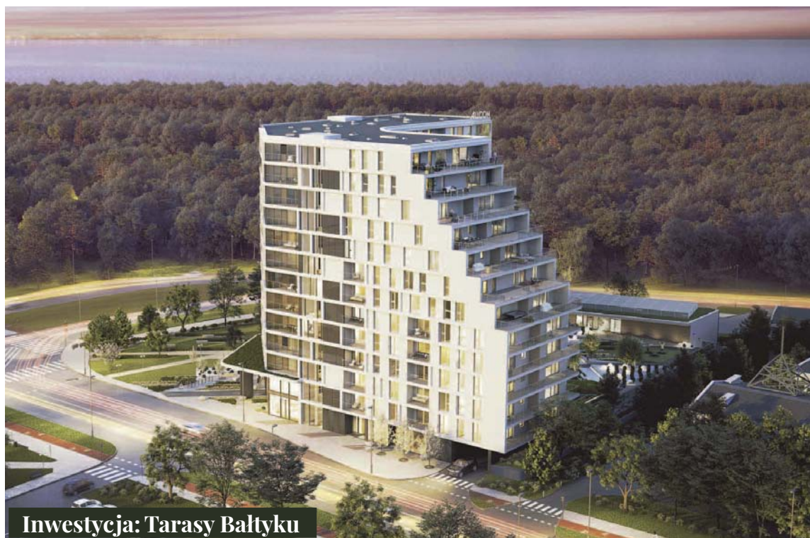
Inwestycja: Tarasy Bałtyku

Allcon to jeden z najbardziej doświadczonych i znanych deweloperów w Trójmieście. Na rynku istnieje od 1990 roku. Wypracowany przez lata model współpracy z klientami, oparty na wiedzy, rzetelności i sprawnym doradztwie, pozwala firmie spełniać oczekiwania zarówno wytrawnych inwestorów, jak i osób poszukujących pierwszego mieszkania. Allcon Osiedla tworzy wyjątkowe, nadmorskie projekty, idealnie wpisujące się w charakter otoczenia. Przykładem są Tarasy Bałtyku – luksusowy apartamentowiec, położony między Gdańskiem a Sopotem, 900 metrów od morza przy największym nadmorskim parku w Trójmieście. Dzięki oryginalnie zaprojektowanej i intrygującej bryle, mieszkańcy wszystkich 12 pięter mogą spodziewać się zachwycających widoków w różnych odśłonach – morza, zielonych, morenowych wzgórz, parku lub panoramy miasta. Na mieszkańców czeka również prywatne patio, sala fitness, sauny oraz sala klubowa z bilerdem. Najwyższe piętra apartamentowca zajmą luksusowe penthousy o powierzchni aż do 163 m 2 . To Trójmiasto w najlepszym wydaniu.