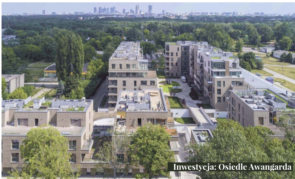
Inwestycja: Osiedle Awangarda