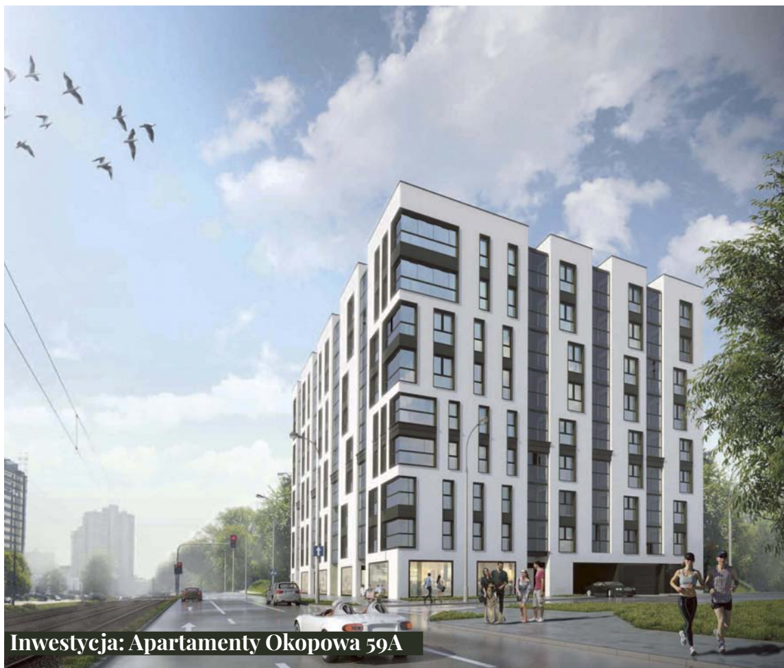
Inwestycja: Apartamenty Okopowa 59A