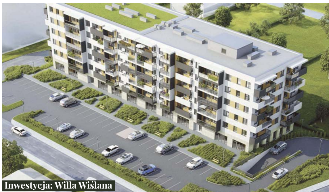
Inwestycja: Willa Wiślana